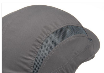
Amplia zona de ventilación