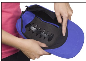
Banda de sudor absorbente

La opción de carcasa completa ofrece una mayor cobertura